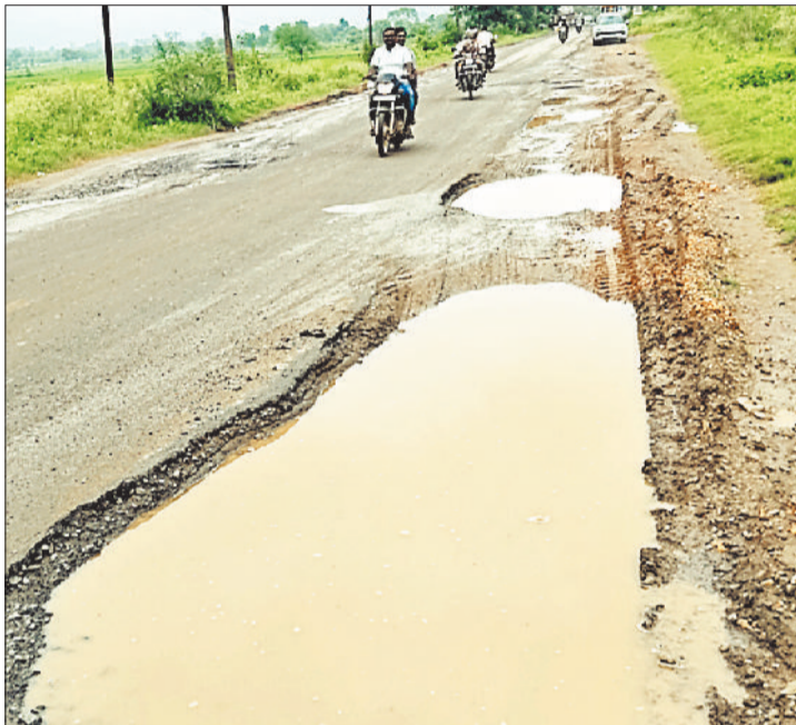
सड़क किनारे बने बड़े गड्ढे पर भरा बारिश पानी।