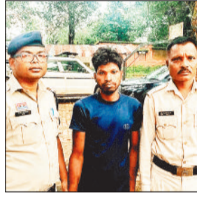
आरोपी को पुलिस ने किया गिरफ्तार, भेजा जेल

रिपोर्ट पर मामले की संवेदनशीलता को देखते हुए पुलिस के द्वारा तत्काल थाना कांसाबेल में आरोपी के विरुद्ध बीएनएस की धारा 137(2) के तहत मामला पंजीबद्ध करते हुए, जांच विवेचना में लिया गया व अपहृत नाबालिग लड़की को पतासाजी की जाने लगी। इसी